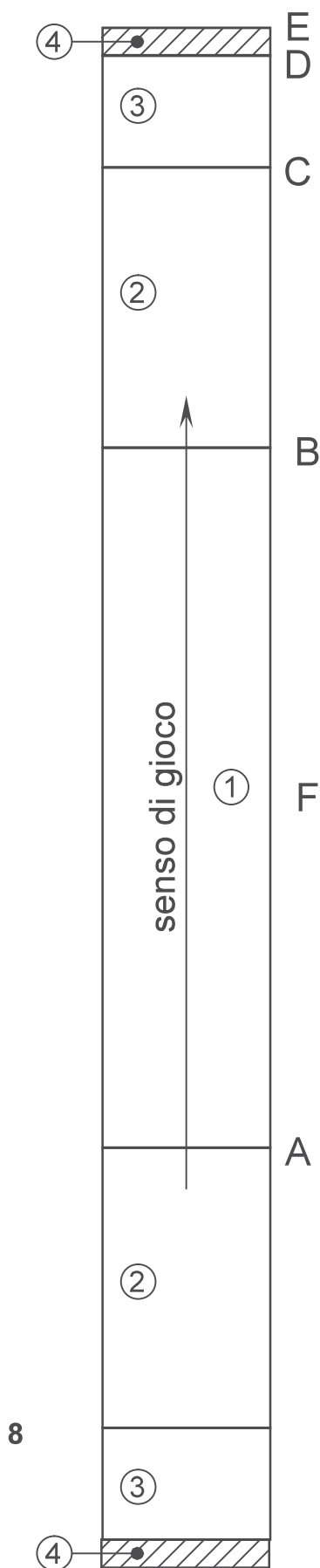
Figura 2: CAMPO

La natura del terreno può essere diversa, ma deve permettere l'applicazione del R.T.I. (tracciatura delle linee, delle marche e delle righe di tiro).